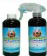
ドッグデオドラント