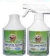
ドッグ・ケア・ウォーター